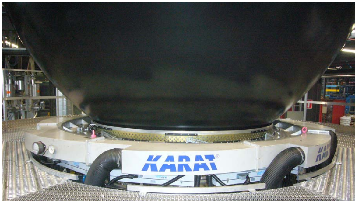
Kühllring KARAT für Düse 2000mm mit motorischer Lippenverstellung und Profilregelsystem VARIOcool (Bild2)

Ein entscheidender Faktor in Bezug auf Folienqualität und Leistung der Anlage im Blasfolienprozess stellt der Kühllring dar. Sehr oft ist der Kühllring das leistungslimitierende Anlagenteil. Aus diesem Grund hat Kdesign den Hochleistungskühllring KARAT entwickelt, der seine Leistungsfähigkeit auf bisher über vierhundert Anlagen täglich beweist. Die Entwicklung des KARAT- Kühllrings basiert auf umfangreichen strömungstechnischen Untersuchungen und umfangreichen Praxis-Tests gemeinsam mit den Kunden. Die Voraussetzung zur Erzielung der optimalen Leistung und Qualität ist eine absolut gleichmäßige Luftverteilung im Kühllring bei geringem Druckverlust und eine Stabilisierung der Blase bei gleichzeitiger Kühlung mit hohem Luftvolumen. Die Kühllringe werden kundenspezifisch ausgelegt auf die entsprechende Applikation und die gefahrenen Formate. KARAT Hochleistungskühllringe sind sowohl für stationäre und rotierende Düsen in der Größe 60mm bis 2200mm verfügbar. Bei Nachrüstungen auf bestehenden Anlagen wurden Leistungssteigerungen von 15 bis 65% erzielt bei gleichzeitiger Verbesserung der Querdickentoleranz.