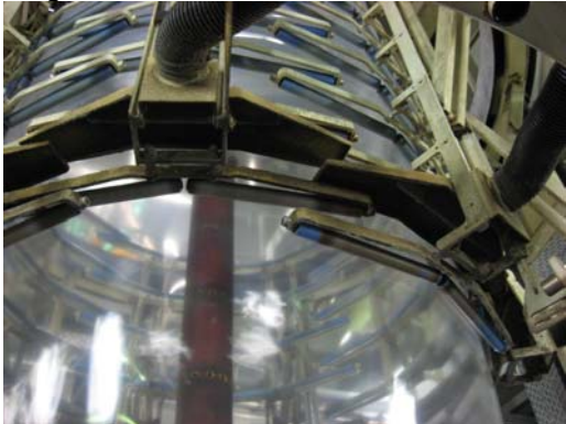
Kalibrierung W&H/Reinhold mit Umrüstung auf markierungsfrei Rollen und nachgerüsteter Monomerabsaugung (Bild 5)

Zur markierungsfreien Folienführung und zur Monomerabsaugung hat Kdesign spezielle Umrüstpakete entwickelt und so können alle gängigen bestehenden Kalibrierungen sowohl mit markierungsfreien Spezialrollen, wie auch mit der Monomeransaugung nachträglich um- bzw. nachgerüstet werden.